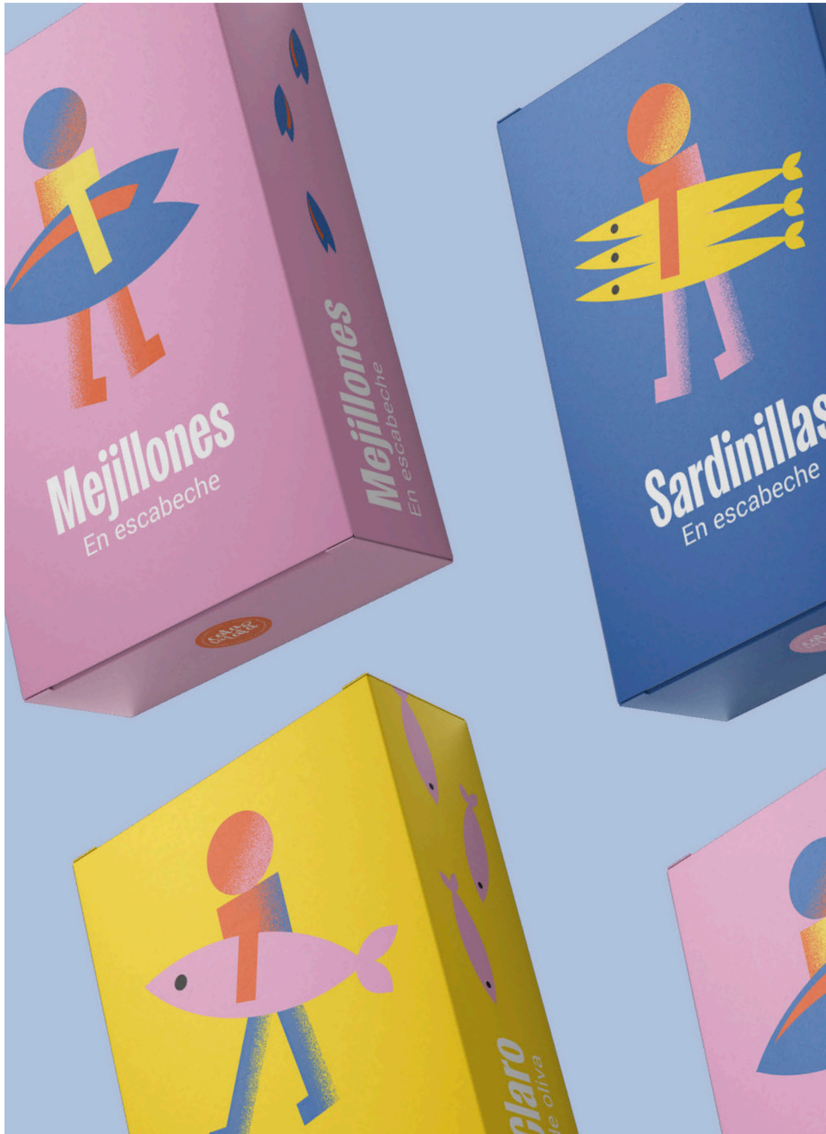
Sheila Pascual Bueno Tarragona, 2002